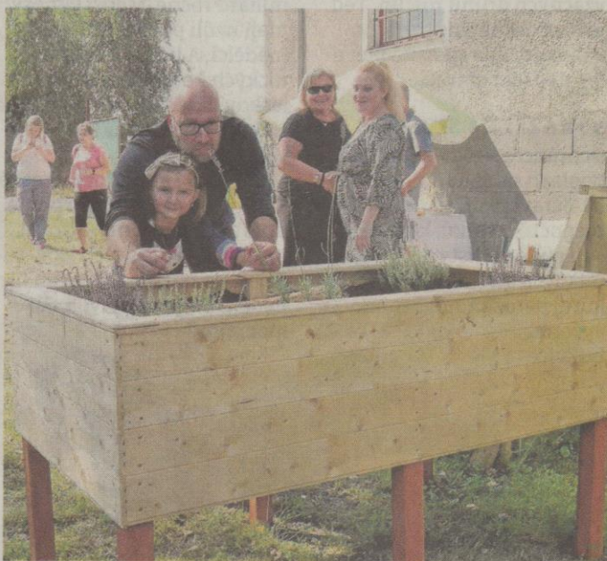
SLAVNOSTNÍ otevření komunitní zahrady Violka.

„Založit komunitní zahradu s dětským hřištěm jsme se rozhodli už loni. Brali jsme to jako výzvu vzhledem k lokalitě, kde se nachází naše kancelář. Doposud tu nebyl prostor, kde by se děti a do-